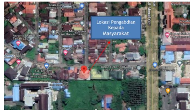
Gambar 1. Lokasi kegiatan Pengabdian kepada Masyarakat

Kegiatan pengabdian ini berlokasi di Jalan Brigjend. H. Hasan Basri, Komplek Kayu Tangi 2, Kelurahan Pangeran, Kecamatan Banjarmasin Utara, Kota Banjarmasin, Provinsi Kalimantan Selatan. Adapun lokasi dan kondisi eksisting rumah kaum masjid Al-Barqah ditampilkan pada Gambar 1 dan 2.