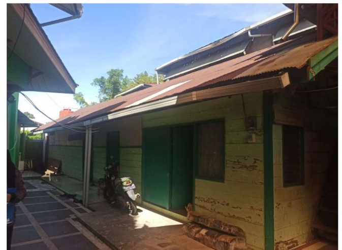
Gambar 2. Kondisi eksisting rumah kaum Masjid Al-Barqah

Pendampingan penyusunan rencana anggaran biaya ini dibagi menjadi 2 tahap: